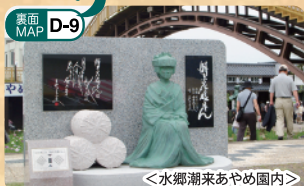
潮来花嫁さん記念歌碑

古くから文人達に愛される潮来は、多くの詩や歌の題材となりました。その代表的な碑を巡りながら、古くも新しい潮来を再発見してみませんか？