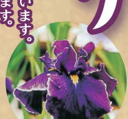
花菖蒲(ハナショウブ)